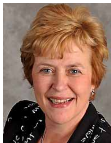
Van Kampen ...volop bezig...

Inwoners uit beide gemeenten merken dat de afstand tot het gemeentebestuur na de fusie is gegroeid. Ze voelen zich nu minder bij de gemeente betrokken en hebben minder contact met de raadsleden en