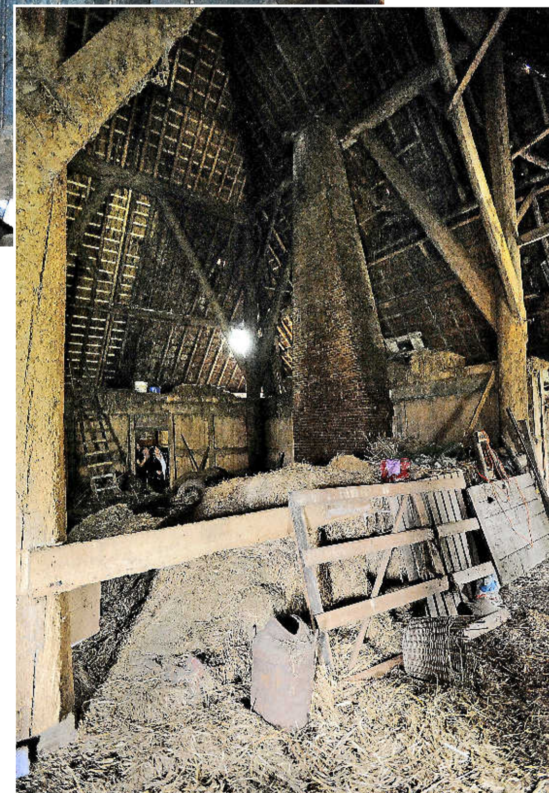
In de stal ook nog een immens rookkanaal. Dat blijft bewaard.