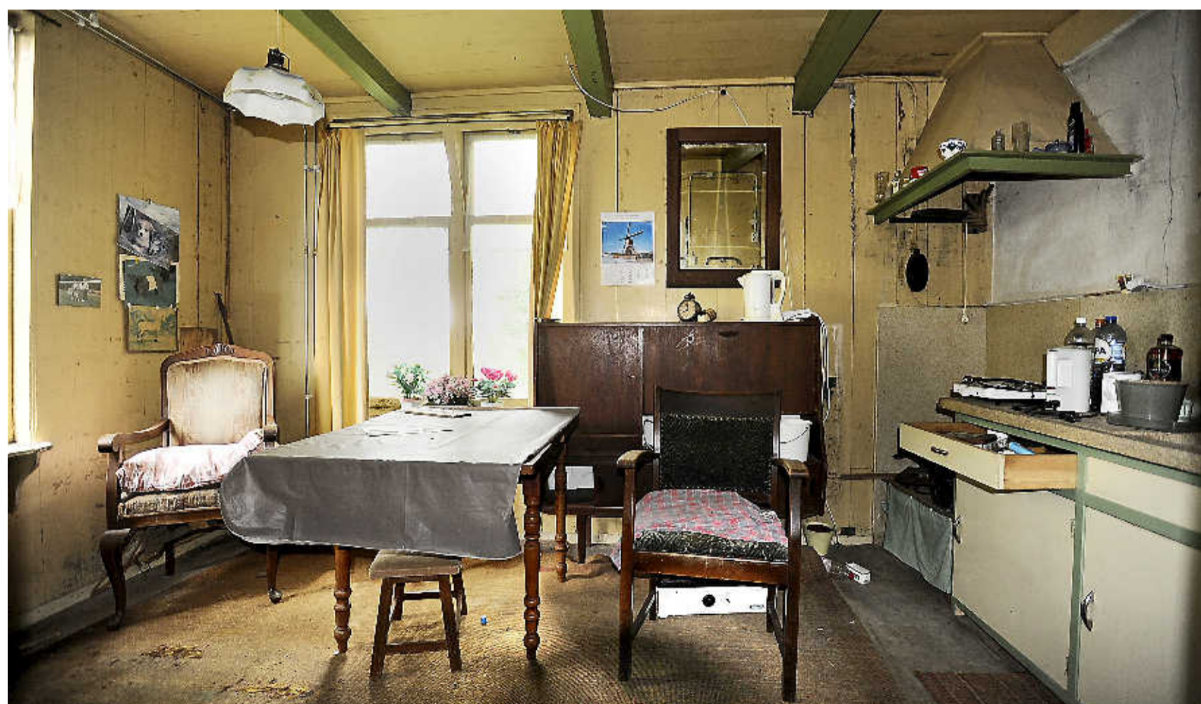
De keuken van Bakker, alsof je terug gaat in de tijd.